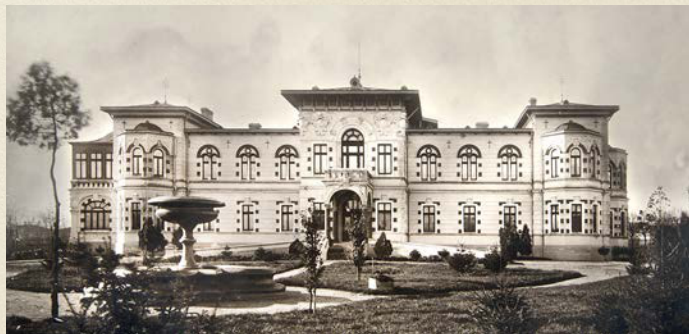
Palatul Episcopal în anul 1901

Clădirea ce găzduiește astăzi Muzeul Istoriei, Culturii și Spiritualității Creștine de la Dunărea de Jos a fost construită la finele secolului al XIX-lea. Ierarhul ales de Dumnezeu pentru a zidi Eparhiei un centru pe măsura importanței ei a fost episcopul Partenie Clinceni ,