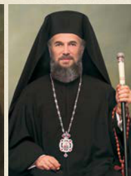
Înaltpreasfințitul Părinte Arhiepiscop dr. Casian Crăciun (1994- prezent)

Chesarie Păunescu, în apărarea cauzei eparhiei invocându-se legislația canonică și Statutul Bisericii Ortodoxe Române, cu referire la proprietatea bisericească. Cu toate acestea palatul a fost confiscat și transformat în Muzeu de artă modern, funcționând în acest regim mai bine de 40 de ani.